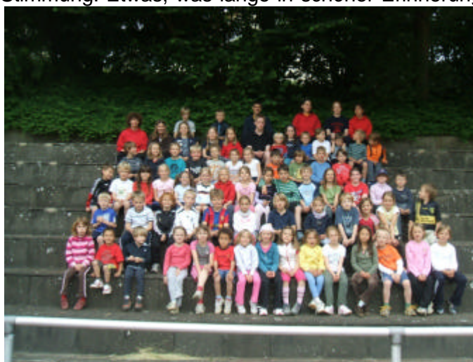
Die Schülergruppe freitags beim Training

Ohne den unermüdlichen Einsatz, die Sachkenntnis und die Kreativität der Trainer, Übungsleiter und mancher Eltern stünde der Verein nicht da, wo er jetzt ist.